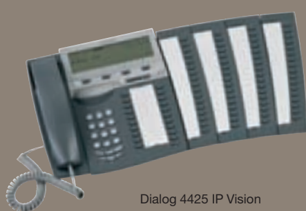
Dialog 4425 IP Vision

Les utilisateurs connectés au MX-ONE™ Telephony Switch disposeront de ce qui suit : les applications utilisateur D.N.A., telles que Ericsson Communication Assistant, l'outil Internet pour la gestion de la téléphonie, Ericsson Communication Client, un téléphone logiciel évolué sur PC, ainsi que Personal Assistant pour Sony Ericsson P9XX ou le Mobile Extension Client, les outils de gestion de la téléphonie d'entreprise sur téléphones mobiles utilisant la plate-forme d'exploitation Symbian OS.