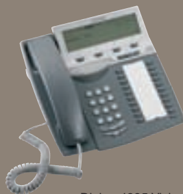
Dialog 4225 Vision